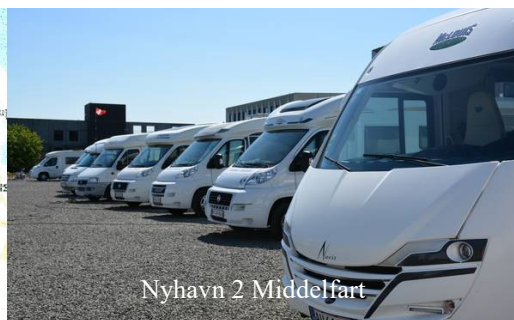
Nyhavn 2 Middelfart