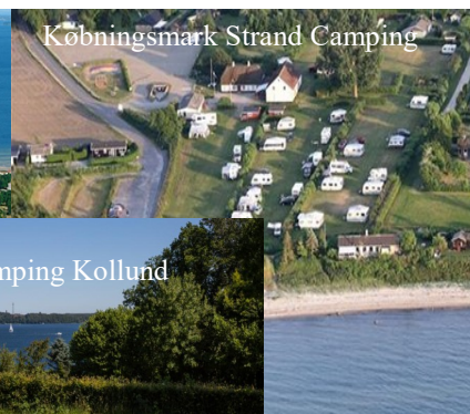
Købningsmark Strand Camping