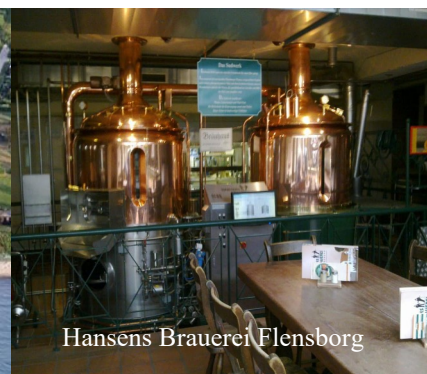
Hansens Brauerei Flenborg

Pris for hele arrangementet Kr. 1135 -/ vogn/2pers. 905-/ 1 pers.(excl. Middelfart + Aabenrå ) Indbetales på Konto nr. 0860 3531064312 senest 20.aug 2018 (Såfremt der er ledige pladser tilbydes disse herefter til ventelistemedlemmer )