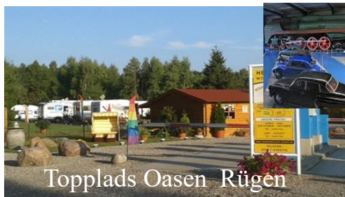
Topplads Oasen Rügen