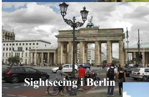
Sightseeing i Berlin

D. 28.– 30 maj 3 dages ophold på Slotshafen stellplatz Oranienburg ca 20 km. fra Berlins centrum Pladsen ligger tæt på byen centrum, Oranienburg slot, og Sachsenhausen konsentrationslejr