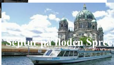
Sejltur på floden Spree

Finn på tlf.,26429832 el. fiknu@klarupnet.dk